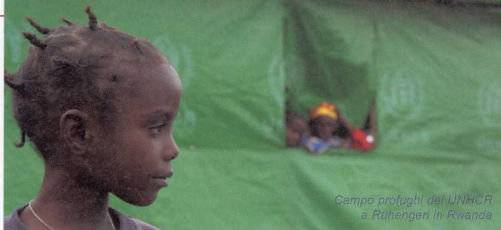
Campo profughi del UNHCR a Ruhengeri in Rwanda